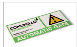
Tabella segnaletica / Signage table AC 40