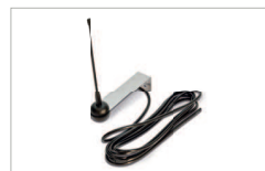
Antenna esterna / Outdoor antenna AC 30