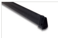
Bordo sensibile di sicurezza Pressure sensitive safety trim 269 L=1000 269 L=1500 269 L=2000 269 L=2500