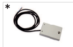
* Finecorsa magnetici Magnetic limit switches AC 205