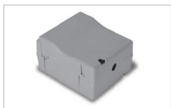
Kit batteria / Battery kit AC 50