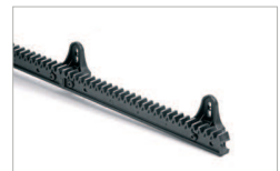
Cremagliere / Racks 261 26x20x1000