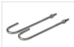
Kit 2 tirafondi M10 Kit 2 anchor bolts M10 AC 230