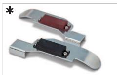
* Kit finecorsa magnetici Magnetic limit switches kit AC 200