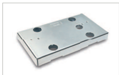
Supporto per scorrevole / Support AC 220