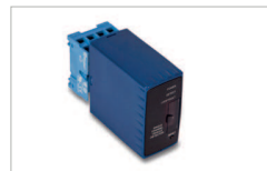
Sensore induttivo / Inductive sensor AC 240